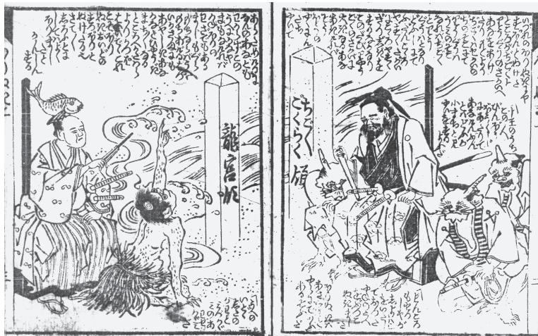
【図5】『金生水洞幹』2ウ3オ

なければ、金掘りの技でもあるまじ、もぐらも地ならば上へ 持ち上げるはず、いかさまにも怪しき穴かな」と評議まち くなる所へ、傍らより河童這い出でて、「これこそ掘り抜 きお井戸のすつぽりと抜けたる也。さて素人にしては良 く掘りました」と感心する。（二ウ三オ）