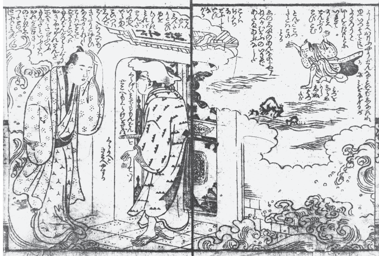
【図3】『齡長尺桃色寿主』6ウ7オ 東京都立中央図書館加賀文庫所蔵

竜宮が海に存在するという考え方は、他の作品にも見られる。『亀屋万年浦島栄』(深川錦鱗作、恋川春町画、天明三年刊)では、物語冒頭で浦島太郎の七世の孫たちが草双紙を読んで浦島が竜宮へ行ったことを知り、自分たちも訪ね行こうと相談する。そして彼らは「竜宮へ行くには海から行くといへば、これから海へ行って潜りを習おふ」と言って(一オ)、竜宮へ行くために素潜りの練習を始める。しかしそこに河童が現れ、海に引きずり込まれてしまう。ちょうどその頃竜宮から帰った浦島はこれを知り、河童を人質にして彼らを助けるのであった。