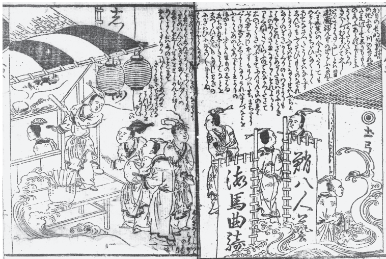
【図4】『箱入娘面屋人魚』1ウ2オ

隅田川西岸、新大橋の南側のこの場所は、安永元年には埋め立てが完了し、安永四年には町屋が建てられた。その広さ九千六百七十七坪、約三・二ヘクタールの中に、九十三軒余りの茶屋が立ち並び、とても賑わっていたという。