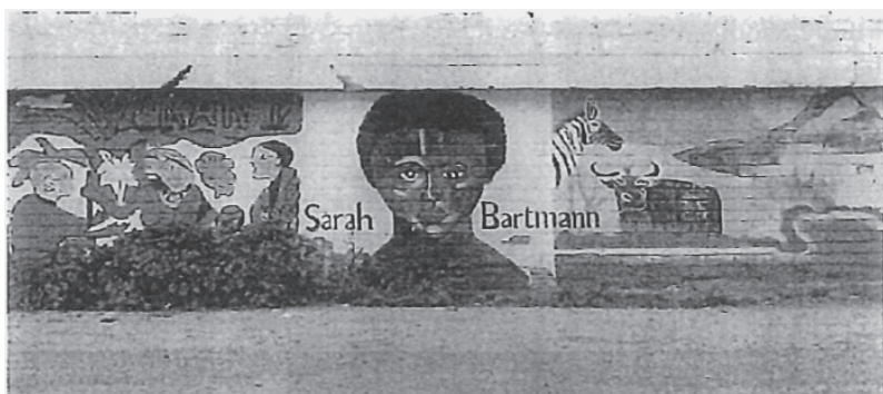
FIGURE 7.1. Mural of Sara Baartman. Hankey, South Africa. Photographer, Clifton Crais, 2005.