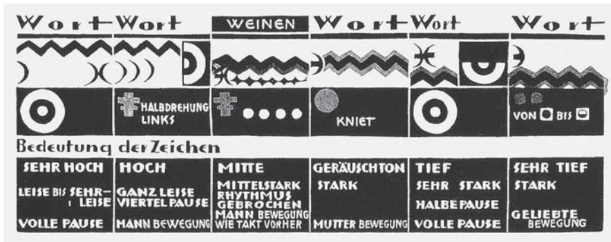
【図1】『磔刑』演技進行表 演技記号

実際に舞台でどれだけ繊細な発声が求められたのかは、木版画で残された『磔刑』の「演技進行表 (Spielgang)」に見て取ることができる。図1は「演技進行表」の記号の読み方を説明した図である。