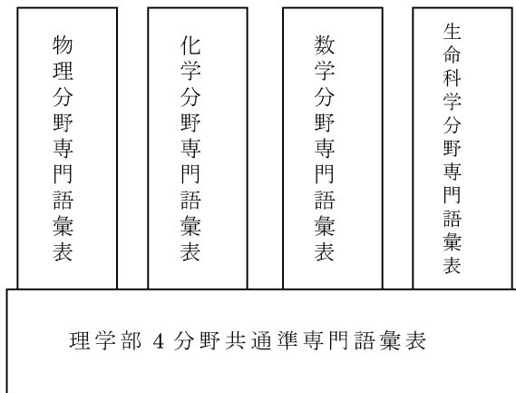
図1. 理学部 ESP 語彙表の基本デザイン

これらを参考に、本研究では本学理理学部の4学科（物理・化学・数学・生命科学）に対応する4分野に、ある程度共通して用いられる準専門語彙と、各分野